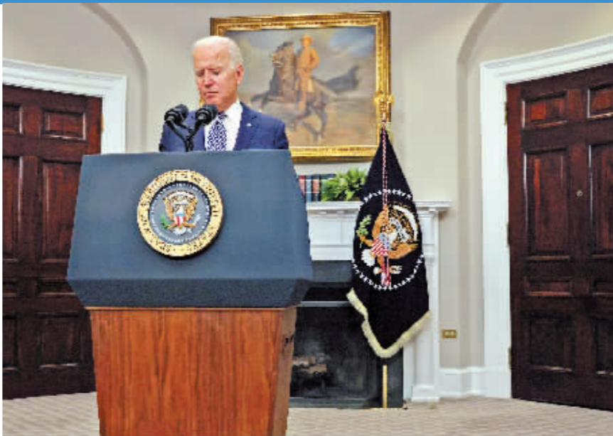
8月24日,美国总统拜登在白宫发表讲话。在被记者问及是否对过去两周美国及其盟国混乱的撤离负有责任,他回答:“从根本上说,我对最近发生的所有事情负有责任。”他同时说,美国撤离阿富汗行动将继续。新华社发

阿富汗首都喀布尔国际机场外26日发生两起爆炸袭击,致使大量阿富汗平民和13名美军士兵死亡,是10年来驻阿美军伤亡最惨重事件。美国前总统唐纳德·特朗普和美国国会多名共和党籍议员炮轰民主党籍总统约瑟夫·拜登的对阿富汗政策,有人要求他辞职,或提议对他发起弹劾程序。