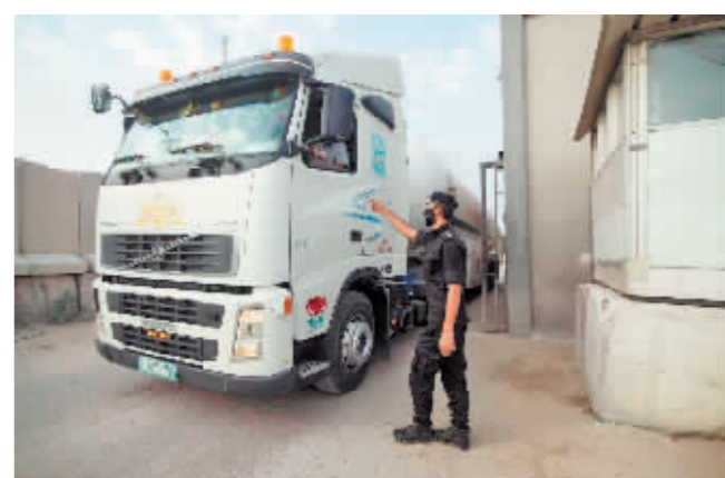
在加沙地带拉法,一辆卡车通过口岸。

新华社北京8月27日电 以色列方面说,将放宽对加沙地带的商业活动限制,允许加沙地带进口更多民用物资和设备。加沙地带局势21日以来一度趋紧。按美联社说法,以方上述举措意在缓解紧张。以色列国防部下属的政府领土活动协调处25日晚发表声明说,26日起,将增加加沙地带用于民用项目的车辆、货物和设备进口;向更多加沙商人发放进入以色列的通行证。这一机构负责协调进出加沙通道事宜。加沙地带西邻地中海,与以色列、埃及接壤。巴勒斯坦伊斯兰抵抗运动(哈马斯)2007年夺取加沙地带实际控制权后,以色列和埃及长期封锁这一狭长地带,严格控制人员和物资出入。埃及方面26日重新局部开放拉法口岸,允许单向通行,滞留埃及的巴勒斯坦人可以返回加沙。拉法口岸是加沙地带3个口岸中唯一不受以方控制的口岸,23日遭埃及关闭。哈马斯方面25日晚些时候宣布,拉法口岸29日起将放开双向通行。埃及关闭拉法口岸2天前,大批巴勒斯坦民众聚集在加沙边境地区示威,与以色列方面发生冲突,造成巴勒斯坦人一死多伤,一名以军士兵头部中枪。今年5月,以色列与加沙地带武装组织爆发严重冲突,持续11天,导致大约260名巴勒斯坦人丧生,13名以色列人死亡。