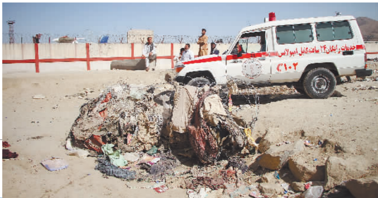
8月27日,一辆救护车停在阿富汗喀布尔机场附近的爆炸现场。喀布尔国际机场外26日发生两起爆炸,导致包括美军在内的重大人员伤亡。极端组织“伊斯兰国”阿富汗分支宣称发动袭击。

美国总统约瑟夫·拜登26日说,美方将打击制造喀布尔机场附近自杀式爆炸袭击的极端组织“伊斯兰国”阿富汗分支。后者自称“伊斯兰国呼罗珊省”。按照一些国际媒体的说法,“呼罗珊”组织与阿富汗塔利班是死对头。“敌人的敌人是朋友”,美国会与塔利班就此合作吗?