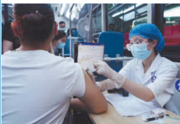
新冠疫苗接种工作有序推进。