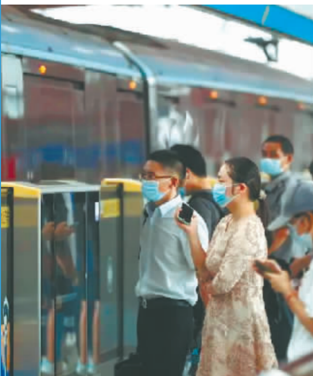
市民出行逐步恢复。