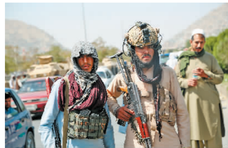
8月16日,塔利班在阿富汗喀布尔街头执拗。

美国外交学会主席理查德·哈斯直言,美国此次战略和道义失败会加深盟友和对手对美国可信度的质疑。