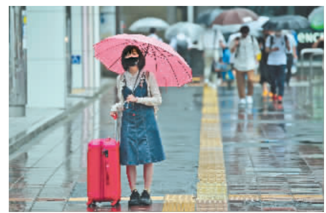
8月17日,一名女子戴着口罩站在日本福冈县福冈市的街上。

据新华社电 日本新冠疫情持续蔓延,重症患者数量不断增加,政府16日决定将茨城、栃木、群马、静冈、京都、兵库和福冈共7个府县追加至防疫紧急状态地区,将从本月20日实施至9月12日。