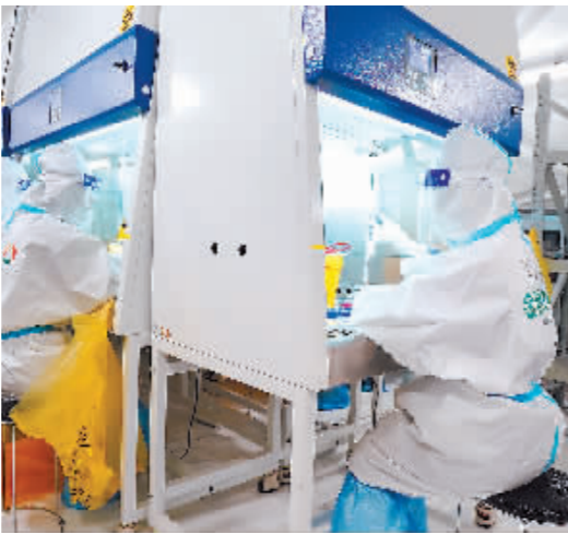
工作人员在实验室工作。

54、37、25、18、18、6、3,是8月10日以来扬州市每日新增的病例数变化。整体数据下降,病例来源结构变化,凸显防控成效。