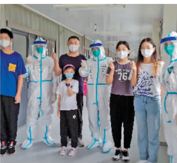
扬州市第三人民医院治疗的首批5名出院患者同医护人员合影。

截至15日24时,江苏全省共报告新冠肺炎确诊病例802例,其中扬州552例,“一老一小”备受关注,据统计,确诊病例中14岁以下患者占比10.1%,最小年龄4个月;高龄患者占比32.7%,最高龄者91岁。