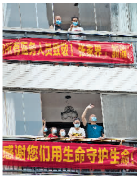
张家界居家隔离的群众向医务人员致意。