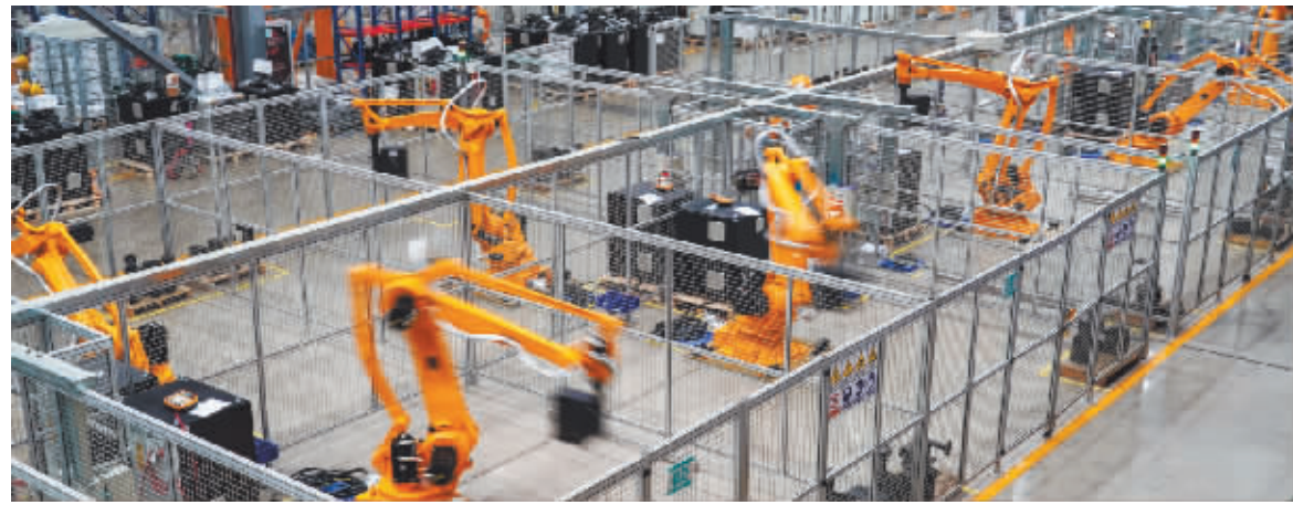
在南京埃斯顿自动化股份有限公司工业机器人生产车间,工业机器人在进行跑合测试。

16日出炉的经济“成绩单”表明,走上半程的中国经济,延续稳定恢复的积极态势。展望全年,面对持续演变的全球疫情和尚未牢固的国内经济恢复基础,保持宏观政策的连续性、稳定性、可持续性,做好宏观政策跨周期调节,加快构建新发展格局,着力推动高质量发展,国民经济有望持续恢复、稳中向好。